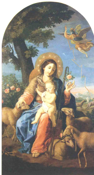
Madonna delle Rose, Nicola Monti 1776